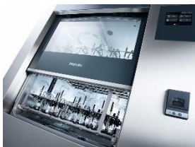
Foto 1: Vysoce účinná laboratorní myčka z řady PLW 86 od Miele. Osvědčuje se především ve velkých laboratořích a lze ji flexibilně osadit prostřednictvím systému „EasyLoad“.