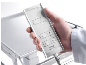
Foto 2: Zvedat a spouštět se dá vozík ATT 86 snadno ovladatelným ručním řízením. Výšková nastavitelnost umožňuje pracovníkům různého vzrůstu dosáhnout do horních pater.